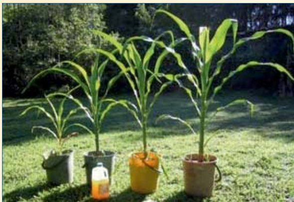
Заараны колдонуу жүгөрүнүн түшүмүн кантип жакшыртат

Заарадагы азык заттарды өсүмдүктөр жакшы сиңирет. Жер семирткич колдонулган өсүмдүктөр тез өсөт, аларда жалбырактар көбүрөөк болот жана алардан көбүрөк түшүм алууга болот. Айыл чарба өсүмдүктөрүнө жер семирткич себүүдө химиялык жер семирткичтердин ордуна заараны колдонуу түшүмдүүлүктүн көлөмүн өзгөртпөстөн акча каражаттарын үнөмдөйт. Бир адам жылына 500 литрге жакын заара бөлүп чыгарат.