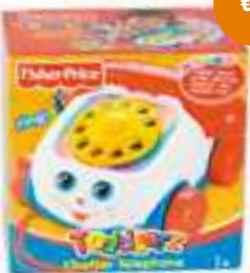
Telefoon Fisher Price