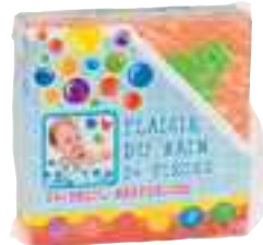
Badspel Sun Ta Toys