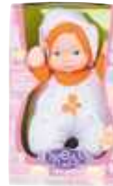
Pop Dream Collection