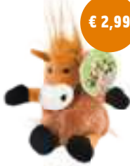
Knuffeldier Eddy Toys